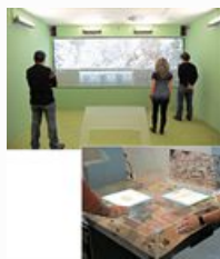
Μουσείο Θεσσαλονίκης Αρχαίοι Μακεδόνες με τεχνητή νοημοσύνη