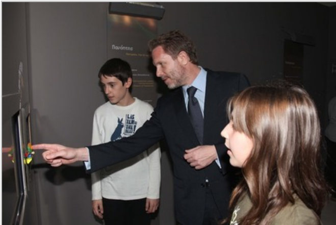
ΤΗΣ ΧΡΥΣΑΣ ΝΑΝΟΥ

Μία έκθεση που δε μοιάζει με τις άλλες, σε ένα μουσείο που δε μοιάζει με τα άλλα. Το Αρχαιολογικό Μουσείο Θεσσαλονίκης γίνεται το πρώτο «έξυπνο» μουσείο στην ελληνική επικράτεια ανοίγοντας τις πόρτες του στην πιο προηγμένη και μάλιστα made in Greece τεχνολογία: αισθητήρες, κάμερες, βιντεοπροβολείς και οθόνες συνομιλούν με ευρηματικό τρόπο με τις πολύτιμες αρχαιότητες της Μακεδονίας δίνοντας την ευκαιρία στον επισκέπτη να εισχωρήσει στον κόσμο του μέλλοντος μέσα από το... παρελθόν.